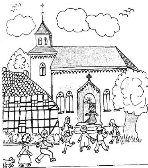
Zeichnung: Anneke Mund

Wir treffen uns an einem Sonnabend im Monat um 15:00 Uhr und feiern gemeinsam mit Papa, Mama oder Großeltern ca. eine Stunde in der Kirche.